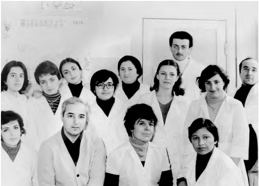
ოსუ, ბიოლოგიის ფაკულტეტი, გენეტიკის კათედრა