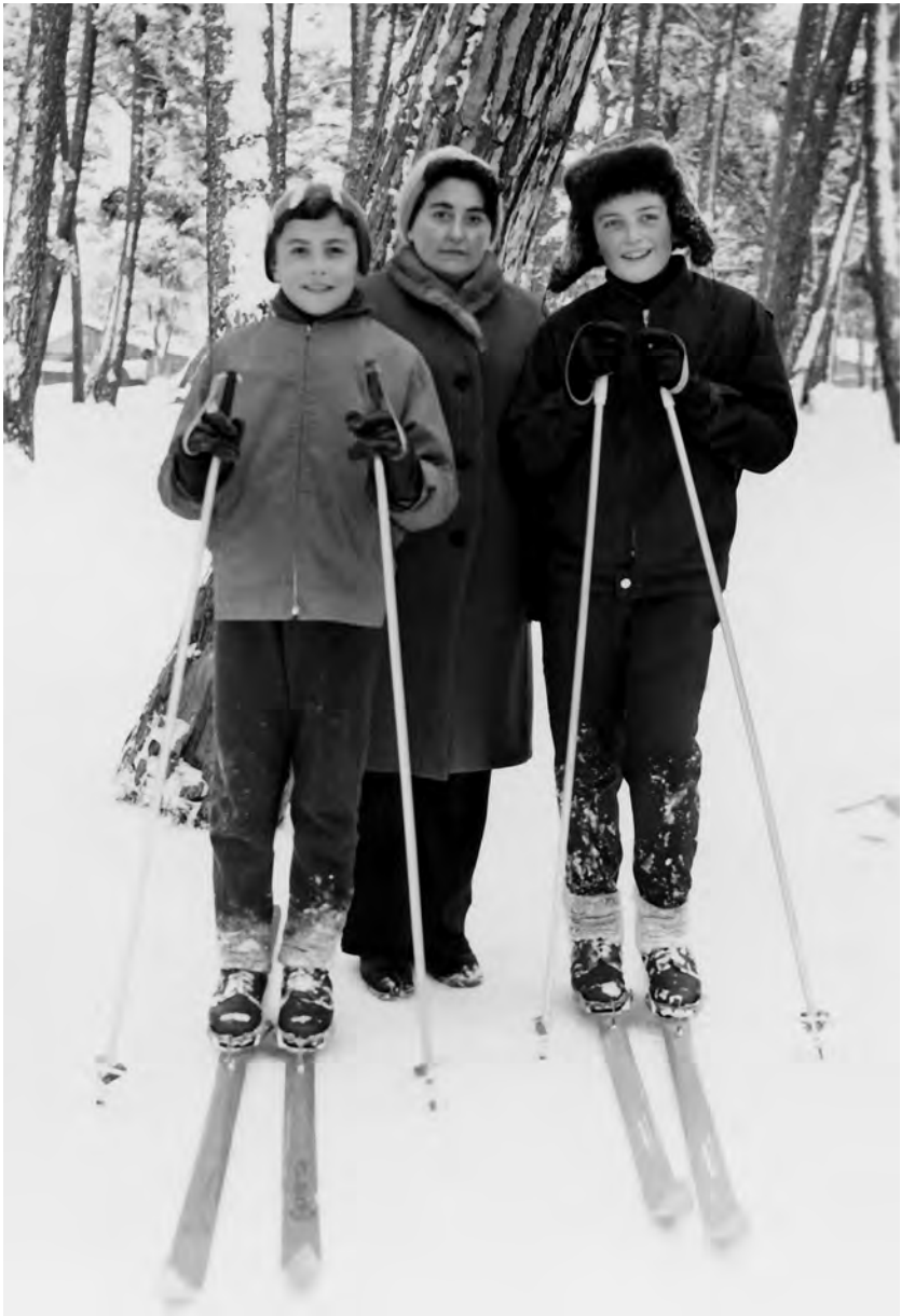
ბაკურიანი, 1975 წ.