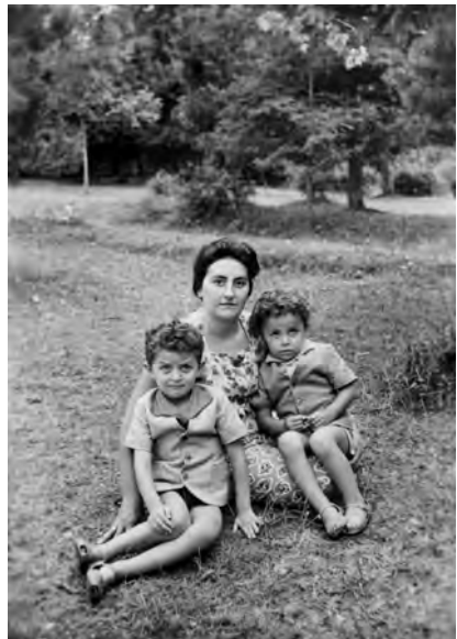
წყნეთი, 1965 წ.