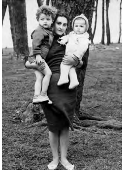
ქობულეთი, 1963 წ.