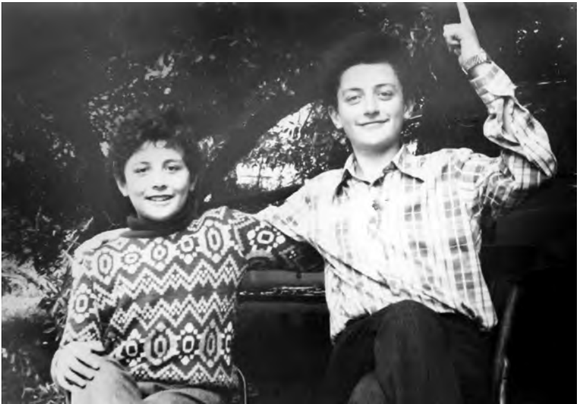
გურია, სოფ. შემოქმედი