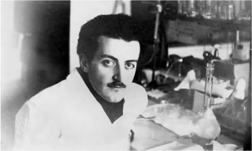
მოსკოვი, მოლეკულური ბიოლოგიის ინსტიტუტის ლაბორატორია