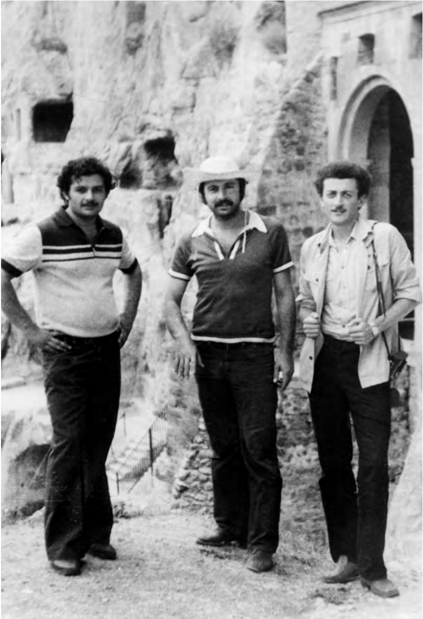
ვარძია, 1980 წ.