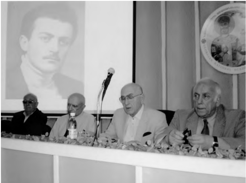
საქართველოს მეცნიერებათა ეროვნული აკადემია, 2009 წ. აპოლონ ჯინჭარაძის გარდაცვალებიდან 20 წლისთავისადმი მიძღვნილი სხდომა